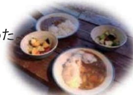
チキンカレー&野菜サラダ