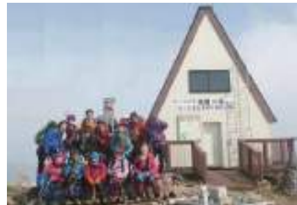
2023年3月 修了山行 氷ノ山

これから本格的な雪山を目指す人のための登山学校です。自分で、雪山テント泊山行が計画できるレベルを目指す登山学校です。