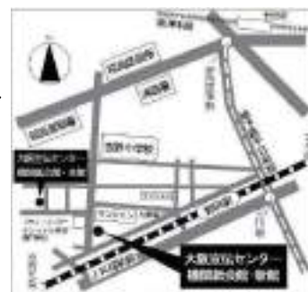
連盟事務所 案内図