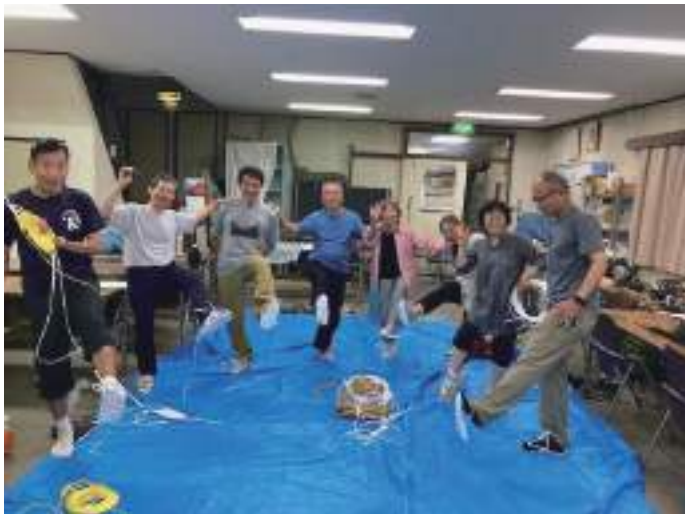
草履が作れて、 うれしくて飛び跳ねる参加者

さる6月10日(土曜日) 冒険学校スタッフ研修会として、わらじ作り講習会を開催しました。参加者は9人で、鍛冶さんの指導のもと楽しく草鞋(わらじ)と草履(ぞうり)を完成できました。