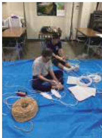
真剣なまなざしで取り組む参加者

この講習会は、労山会員全員に公開されており、冒険学校を手伝わなくてもだれでも参加できます。来年も開催しますので、ぜひ御参加願います。