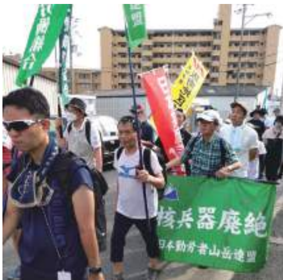
「核兵器廃絶」を掲げて忠岡町辺りを元気に歩いた