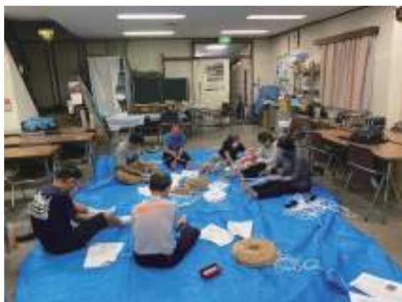
こんな感じで鍛冶さんから手ほどきを受ける

子供の冒険学校の夏のキャンプでは、沢登りの時に地下足袋と草鞋を履いて登ります。そして子供達には草鞋を作ってもらいます。夏休みの工作として学校にも提出できるレベルを目指していますが、そのためには大人もしっかり作れるようにという意味を込めて開催しました。