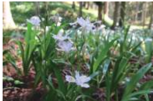
谷間を埋め尽くすシャガの群生

5月4日には老富の奥地の谷間に広がるシャガの群生地を訪ねました。現地の管理人さんは「今年は新芽の段階で鹿に食べられてシャガは少な目ですが…」と仰っていましたが、それでも谷間をシャガが埋め尽くして多くの観光客を楽しませてくれました。