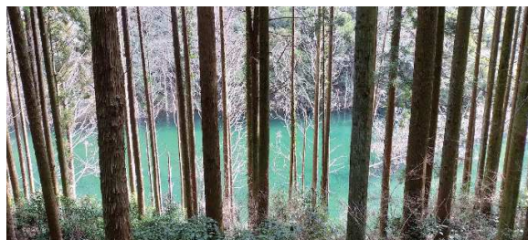
植林越しに見る大正池

六甲森林植物園 09:50 10:24 東門 10:59 河童橋 11:10 崩壊地 11:18 黒岩尾根取付 12:48 風の丘 13:18 13:25 摩耶山頂 14:33 東門