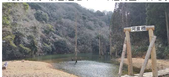
トエンティックロスの河童橋と大正池

六甲森林植物園に車を止め、高山植物のロックガーデンに立ち寄り、節分草や福寿草を鑑賞し、東ゲートを出る。ここから市ヶ原間は歩いたことがなく、トエンティックロスを初めて歩く。しばらく下ると木橋に河童橋と名があり、何とその先には立ち枯れの木が残る水面が広がっている。まさしく六甲の大正池だ。その先の崩壊地は大岩が転がってはいるが、トレースが刻まれている。地蔵谷出合い手前から黒岩尾根に取り付き、摩耶山頂を目指す。黒岩尾根は40数年ぶり。昔の面影はなし。松の木がいい雰囲気できて、昔より優しい感じ。摩耶山頂に天狗岩大神が祀られた神社あり。何べんも通過した摩耶山だが、頂上も神社も初めて訪れた。桜谷道を下って植物園に帰る。