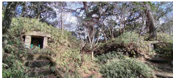
シュラインロードの野仏

神鉄・唐櫃台の団地Pに車を止め、逢山峡・東山橋から有馬三山最高峰・湯槽谷山へ突き上げる尾根に取り付く。途中、高尾山に先行者一人。湯槽谷峠先の高台で六甲有馬ロープウェイの赤い車体が静かに下って行くのを見る。番匠屋畑尾根登山道のと真ん中にはロープウェイのトラス柱が建つ。極楽茶屋跡の広場はいい休憩地。昼食後、ドライブウェイを歩き、六甲山ホテルのある前ヶ辻から北上するシュラインロードを下る。因みに南下する道はアイスロードで、これらの道は酒米や農産物、海産物を牛の背に載せ運んだ所という。よく踏まれた古道は野仏が多くみられるのでシュライン（崇拝の対象が存在する場所）と名が付くらしい。裏六甲ドライブウェイを渡り、峰山峡・猪ノ鼻滝を鑑賞し、車に戻る。