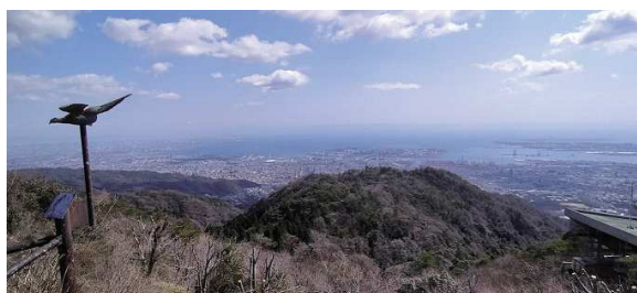
天覧台から神戸市街を見る

極楽茶屋跡 08:54 09:20 西お多福山 10:05 住吉川 10:34 雨ヶ峠 10:58 土樋割峠 11:07 東お多福山 11:45 11:36 12:21 蛇谷北山 12:39 石の宝殿 13:00 六甲最高峰 13:40 極楽茶屋跡