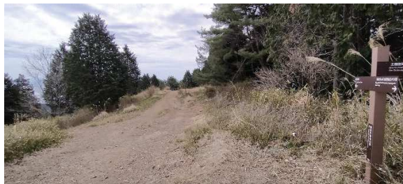
東お多福山山頂広場

極楽茶屋跡の広場に車を止め、西お多福山へ。全山縦走路は六甲ドライブウェイと付かず離れず続く。西お多福山の舗装道路を離れると、明るい笹の斜面を縫って登山道は下っていく。途中、西滝ヶ谷側への大崩落地を通過。この谷の上部は水晶谷、極楽溪と続き、極楽茶屋へ突き上げる。行方不明の登山会を探しに、ソンドを持ってかつて搜索した所だ。住吉川を渡る。綺麗な流れだ。雨ヶ峠から尾根伝いに東お多福山のつもりだったが、再び住吉川へ下りてしまった。土樋割峠から登り返す。40数年前はススキの原だった(はずの)山頂広場は周りに大きな木が茂っている。大阪湾を眺めつつ昼食。蛇谷北山、石の宝殿、最高峰を経、車に帰る。